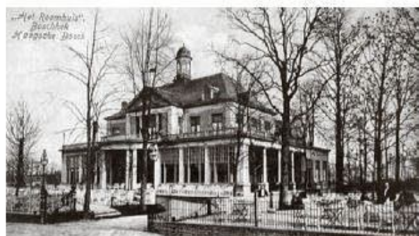
- Een vooraanzicht van Boschhek op een prentbriefkaart uit 1912. -

Insturen per e-mail naar lezersreacties@deoud-hagenaar.nl mag natuurlijk ook. Vergeet niet uw postadres te melden!