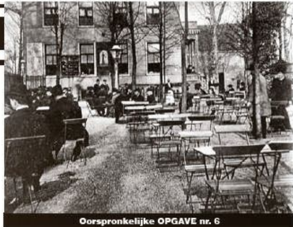
Oorspronkelijke OPGAVE nr. 6

Toen ik in de zomer van 1952 in het Bezuidenhout kwam wonen, waren er alleen nog de tennisbanen en wat lage bijgebouwen en muurtjes over, zo herinner ik me. Toch waren er in