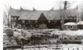
- Het voormalige Minangkabause huis, dat in 1968 op het punt slaat te gaan verdwijnen. Op de voorgrond de bouw van Résidence Château Bleu. -

het bestond schijnbaar uit meerdere gedeelten die elk in een hoornvormig gebogen ijzeren punt eindigden.