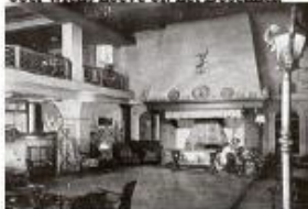
- De danszaal van Château Bleu op een foto uit 1942. -

"Schuitje varen, theetje drinken, varen we naar de Overtoom, drinken we zoetemelk met room, zoetemelk met brokken, kindje mag niet jokken." Koning Willem I schijnt overigens de grondlegger van dit roomhuis te zijn geweest. Hij mocht graag met zijn gevolg zure room gaan drinken bij een boer wiens hoeve bij het Boschhek