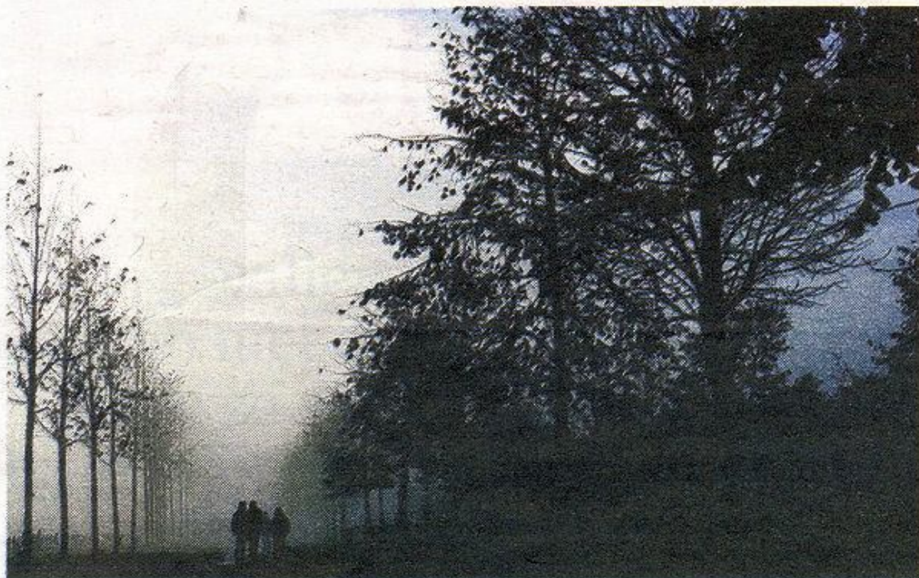
Willem van Oranje verzet zich tegen verkoop van het Malieveld.