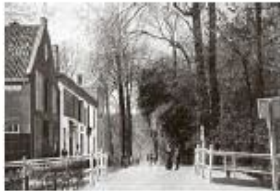
- Een prentbriefkaart uit 1903 die Boschhek aan de Leidsestraatweg toont (Uitgave: Leipzig Trenkler Co.) -

er achter. Dat oude huis en die grote tuin hebben een grote rol gespeeld in tienduizenden Haagsche kinderlevens, en menige volwassene, die nu zo tegen de veertig loopt, kan 't maar niet genoeg vinden in 't prachtige Hotel-restaurant, waaromheen 't zonnig is geworden. Het oude Boschhek, 't lag zoo liefelijk verscholen in 't geboomte, en wie er zomers met een hart, kloppend van blijdschap op af stevende, zag pas een paar roode daakjes uit de boomen verrijzen, als hij het oord zijns verlangens al tot heel dichtbij genaderd was." Blijkbaar vonden veertigplussers de nieuwe ontwikkelingen maar niks.